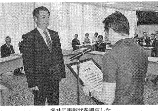
各社に表彰状を授与した