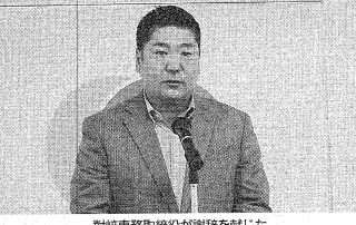
対崎専務取締役が謝辞を献じた